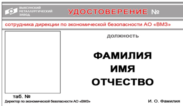
Рисунок 1 – Образец удостоверения работника дирекции по экономической безопасности АО «ВМЗ» (лицевая и оборотная стороны соответственно)