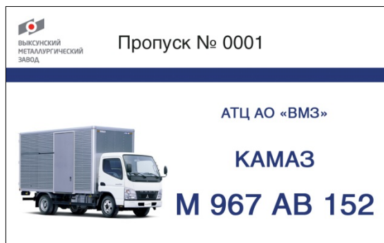
Рисунок 4 – Образец временного электронного пропуска на автотранспортное средство АТЦ АО «ВМЗ» (лицевая и оборотная стороны соответственно)

Данный пропуск является собственностью ОАО «ВМЗ» и его владелец несёт персональную ответственность за его сохранность. Категорически запрещается осуществлять въезд на автотранспортном средстве, не предусмотренном данным документом. При выявлении подобных случаев пропуск изымается у лица, предъявившего его. В случае перерегистрации и окончания срока аренды автотранспортного средства пропуск сдать в бюро пропусков ОАО «ВМЗ».