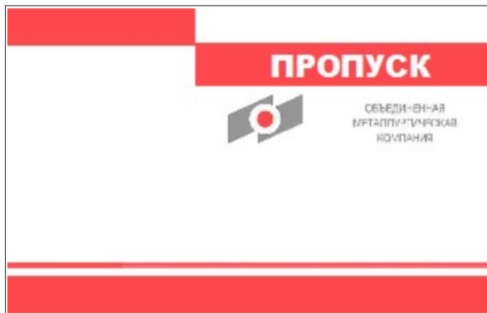
Рисунок 3 – Образец личного постоянного пропуска работника АО «ВМЗ» либо аффилированных с АО «ВМЗ» Обществ

Рисунок 2 – Образец личного постоянного электронного пропуска работника АО «ОМК»